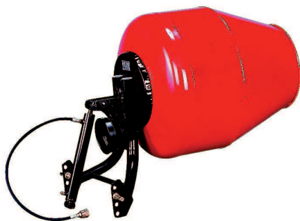
BAH TB7 350 litres (2 sacs - 25 kg) Basculement hydraulique