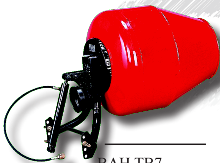
BAH TB7 350 litres (2 sacs - 25 kg) Basculement hydraulique