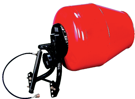
BAH TB7 350 litrów (2 worek - 25 kg) Przechylenie hydrauliczne