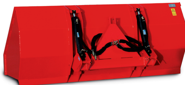
GA25 1450 litrów