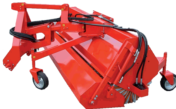
BY230ML : Opis na odwrocie