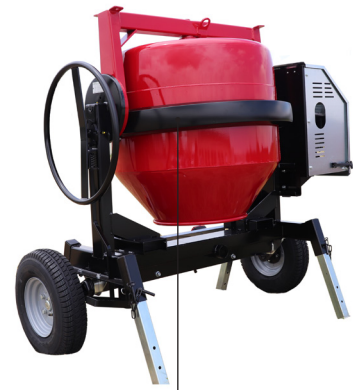
Carters de protection de couronne en acier. Timon anneau d'origine ou timon boule \varnothing 50 sur demande