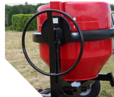
Volant grand diamètre.