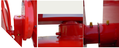
Points de graissage sur toutes les rotations.