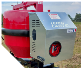
Capot moteur ventilé.