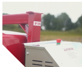
Arrêt coup de poing.