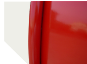
Rebordage virolle renforcé.