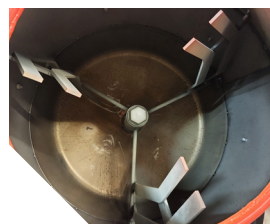
Cuve renforcée avec 3 pales de malaxage.