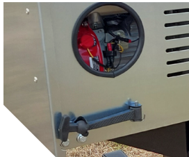
Maintien du capot par fermeture caoutchouc.