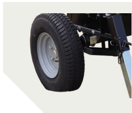
Roues 500 x 10 et pédale en fer-plat permettant une bonne prise au pied.