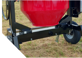
Renforts châssis avec prises fourreaux incorporés.