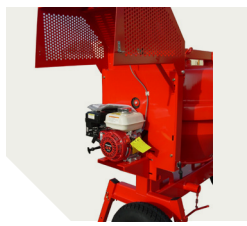
Entraînement courroie simple ou double selon motorisation sur modèles