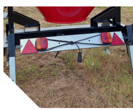
Livrée avec plaque signalétique.